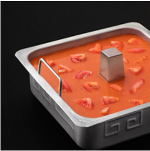
Tomato Soup Base