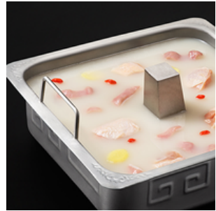
Chicken Soup Base