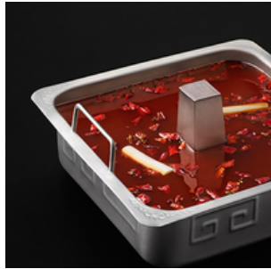
Spicy Seafood Soup Base