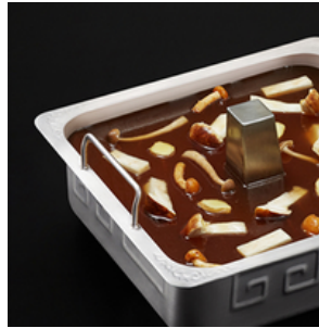
Mushroom Soup Base